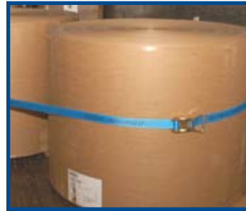
Boucle métallique et boucle à cliquet

Certifié AAR pour répondre et dépasser les normes ASTM 3950-06 pour les sangles Ty2 de 1 1/4 po et 1 5/8 po destinées au remplacement des bandes d'acier.