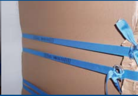
Boucle métallique ou boucle à cliquet