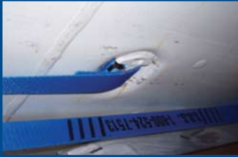
Matériel de montage latéral