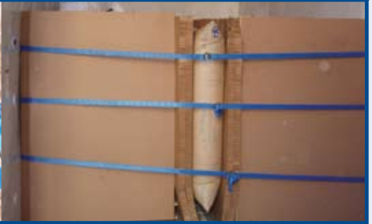
Systèmes approuvés par AAR