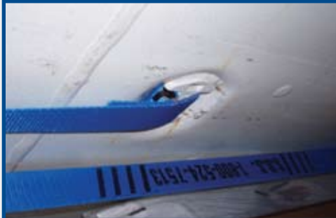
側面取り付け金具