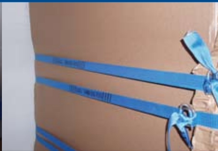
リングバックルまたはラチェットバックル