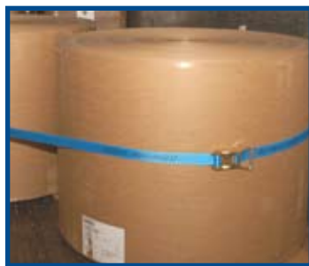
リングバックルとラチェットバックル

スチールバンドに代わるものとして、Ty2 Strap 3.2cm および 4.1cm ものは、ASTM 規格3950-06 に適合かつそれを超えるとして米国鉄道協会の認定を取得しています。