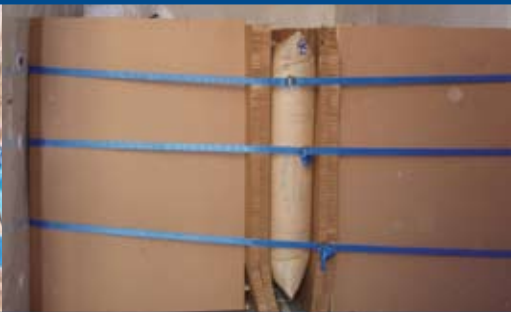
AAR (米国鉄道協会) 認定システム